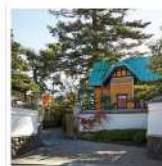
老舗料亭「か茂免」お食 い初めプラン 50,000POINTS