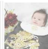
お宮参りと記念撮影プラン (ご自宅より送迎付) 50,000POINTS

令和2年、3年、4年に赤ちゃんを出産した名古屋市内在住のご家族に、50000ポイント(50000円相当)をプレゼントする、名古屋市の子育て支援事業【BABYYELL】。その運営の一部を担い、主に愛知県内での体験や旅行商品を企画提供し、お客様からの受注、手配、実施、精算までの一連の業務を行う。旅館での宿泊プランや料亭か茂免でのお食い初め、老舗八百彦本店のお食い初めデリバリー、スタジオアリスでの撮影等、幅広い商品を取り扱う。