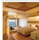
竹島水族館とホテル竹島 スカイビューフロア宿泊 50,000POINTS