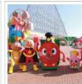
長島温泉ホテルナガシマ 宿泊と名古屋アンパンマン こどもミュージアム& パーク (平日・休日宿泊 限定) 50,000POINTS