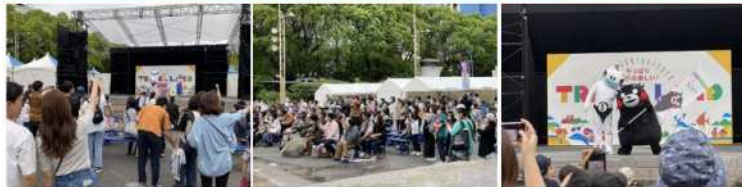
中京テレビアナウンサーがMCを務め、イベントを盛り上げます。